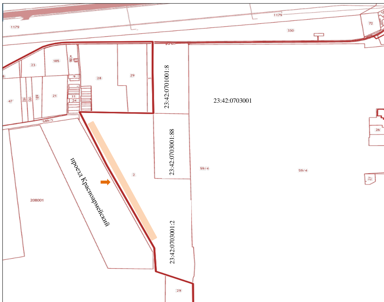
Схема расположения вновь образованного проезда «Красноармейский» в кадастровом квартале 23:42:0703001 в городе Ейске Ейского городского поселения Ейского района

УТВЕРЖДЕНА постановлением администрации Ейского городского поселения Ейского района от 21.03.2023 № 252