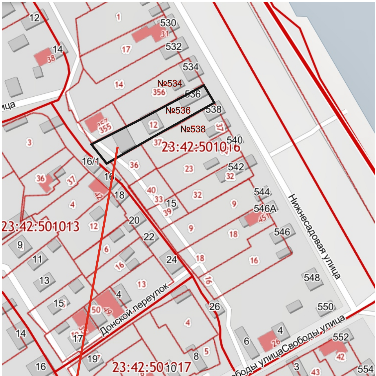
Схема расположения земельного участка по улице Нижнесадовой, 536 в городе Ейске Ейского района

земельный участок по улице Нижнесадовой, 536