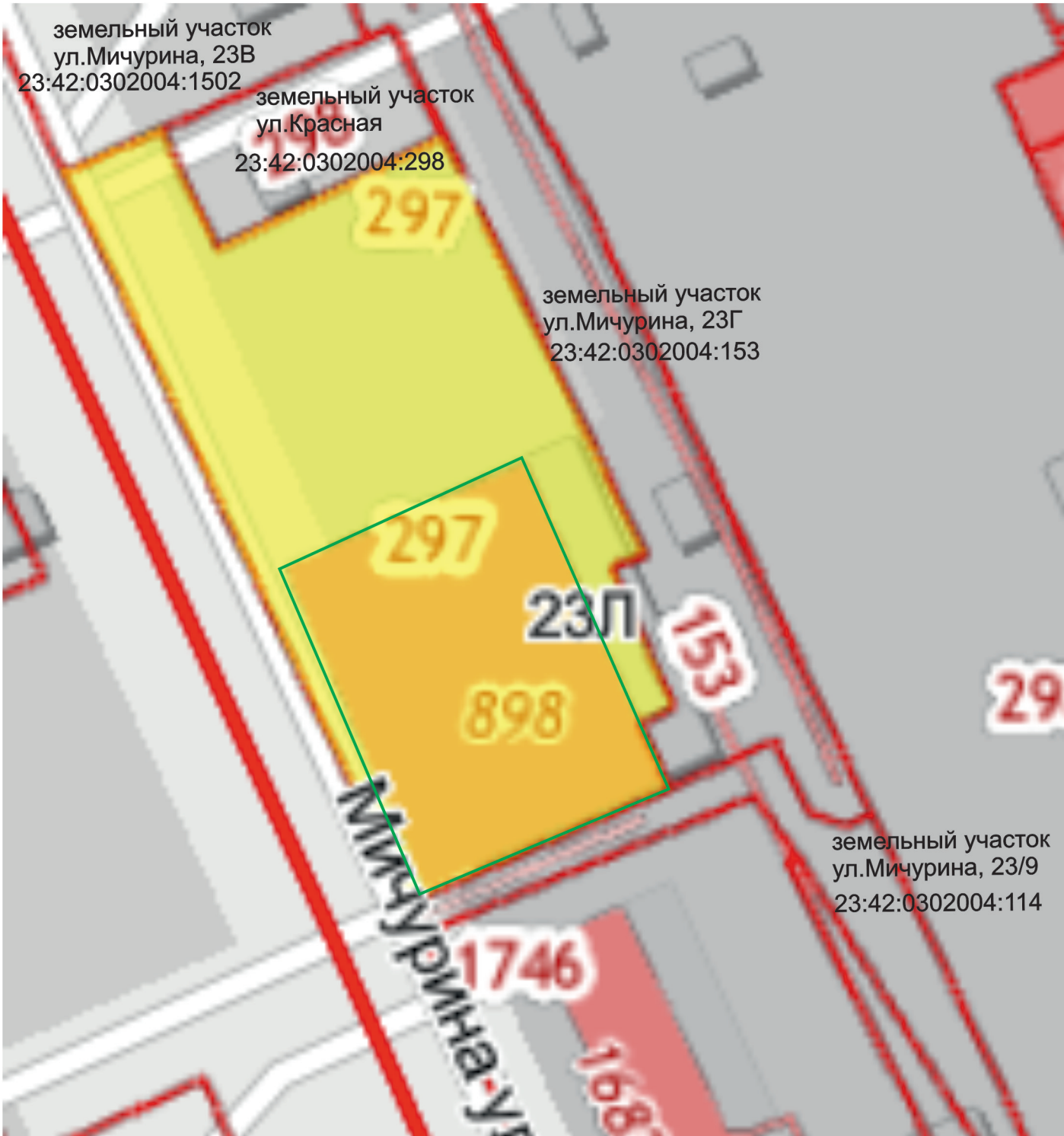
Схема расположения земельного участка по улице Мичурина, 23 Л в городе Ейске Ейского района