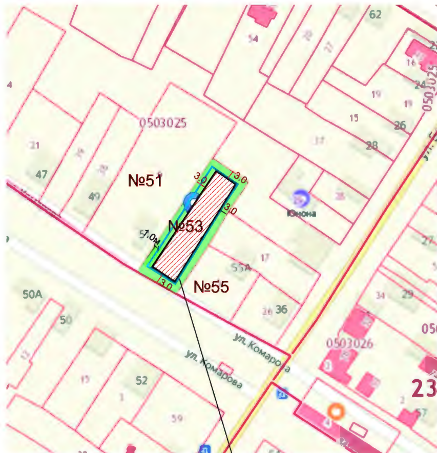
Схема расположения земельного участка по улице Комарова, 53, в поселке Широчанка Ейского района

земельный участок по улице Комарова, 53 в пос.Широчанка